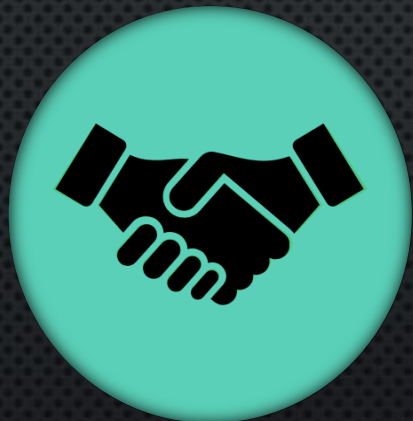
Работа с ФОИВами