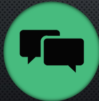
Социальная сеть Я-эксперт